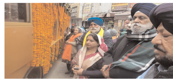
हुनर का प्रदर्शन कर रही थीं। नगरकीर्तन में गुरुपर्व प्रबंधक कमेटी

कर्ण गेट, कमेटी चौक, सब्जी मण्डी चौक, कुंजपुरा रोड, हस्पताल चौक, सैक्टर 12, निर्मल कुटिया, गुरुद्वारा सैक्टर-7, गुरुद्वारा बाबा कश्यपरा सिंह जी सैक्टर-6 के पीछे, मेरठ रोड, महाराणा प्रताप चौक से होता हुआ गुरुद्वारा डेरा कार सेवा कलन्दरी गेट पहुंचा। गुरु साहेब की पालकी के आगे की फूलों की बारिश कर रहे थे। इससे आगे धमालु पानी का छिड़काव कर रहे थे। इसके आगे कीर्तनी जल्ये चल रहे थे। लगह लगह लग्र प्रसाद वितरित किया गया। नगर कीर्तन में गतका पार्टियां अपने