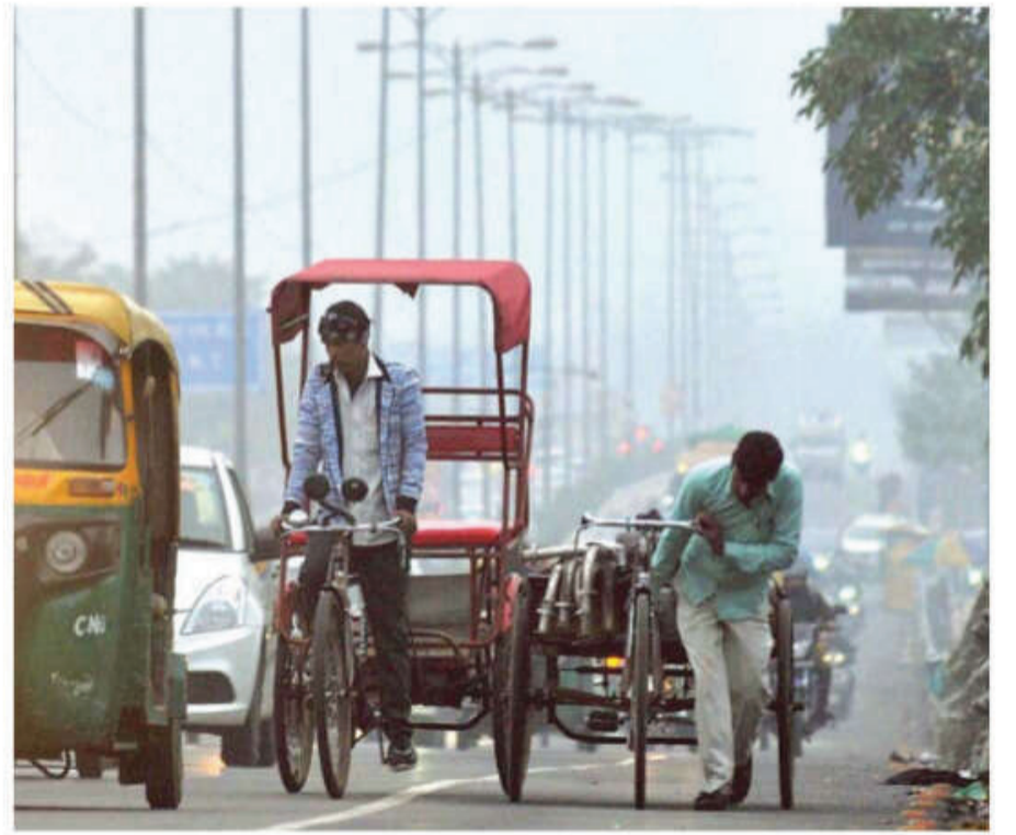
घने कोहरे के बीच चलते वाहन।