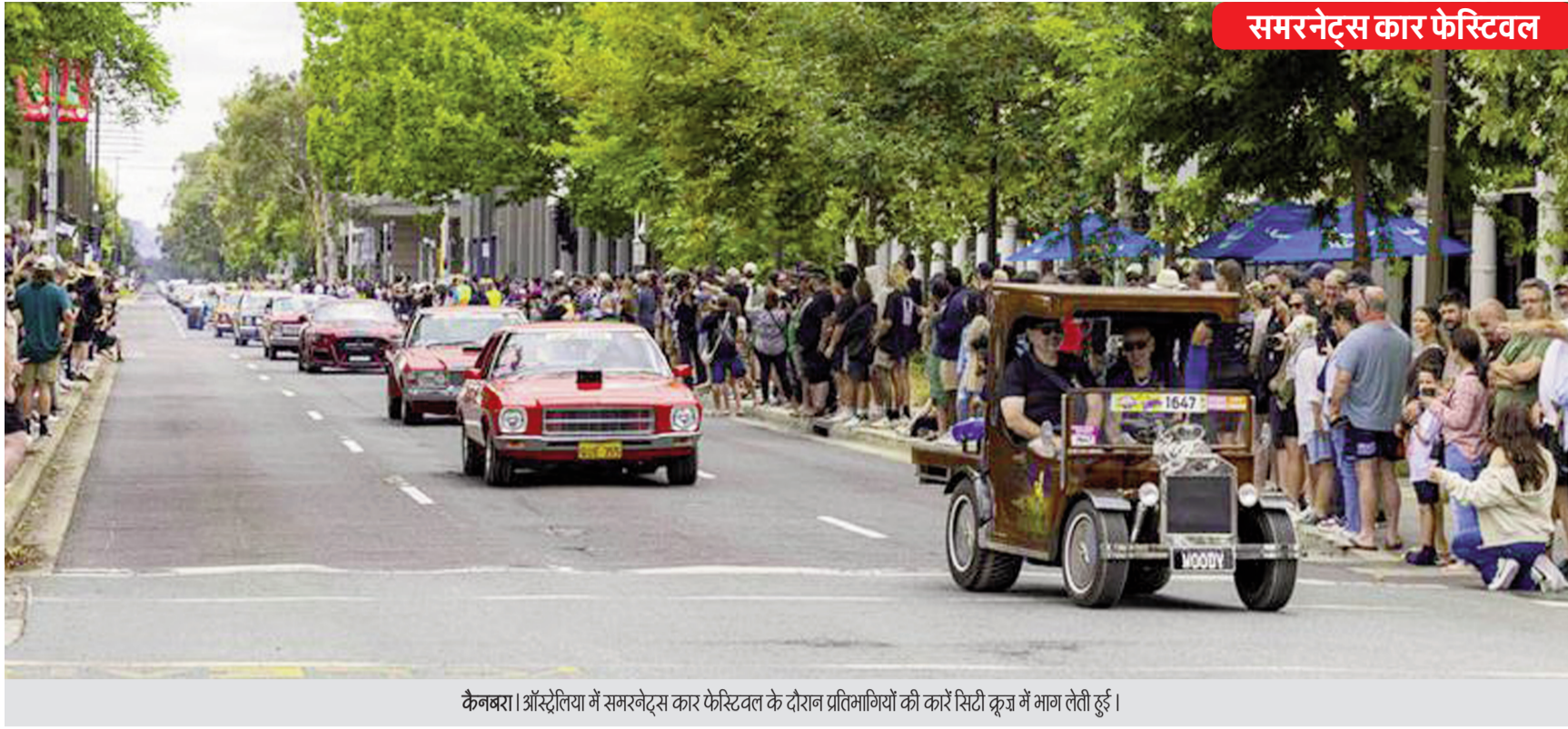
कैनबरा। ऑस्ट्रेलिया में समरनेट्स कार फेस्टिवल के दौरान प्रतिभागियों की कारें सिटी कूज में भाग लेती हुईं।

सियोल। दक्षिण कोरिया के अपदस्थ राष्ट्रपति यून-सुक-येओल के खिलाफ स्थानीय अदालत की तरफ से गिरफ्तारी वार्ंट जारी किए जाने के बाद येओल के समर्थकों ने उनके आवास के बाहर प्रदर्शन शुरू कर दिया है। कड़क की टंड में प्रदर्शनकारी येओल के खिलाफ कार्रवाई को गंवारि बताते हुए उन्हें सभी आरोपों से मुक्त करने की मांग कर रहे हैं। मालूम हो कि येओल ने पिछले महीने दक्षिण कोरिया में कुछ समय के लिए मार्शल लॉ लगा दिया था। इसके बाद उन्हें महाभियोग के जरिये पद से हटा दिया गया है।